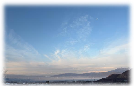
校舎から望む、早朝の山並み

総合的な学習の時間「ふるさと高山」の学習をはじめ学校の様々な活動に対し、保護者の皆様、地域の皆様に沢山のご支援をいただきました。心より感謝申し上げます。3学期もご支援、ご協力よろしくお願いいたします。